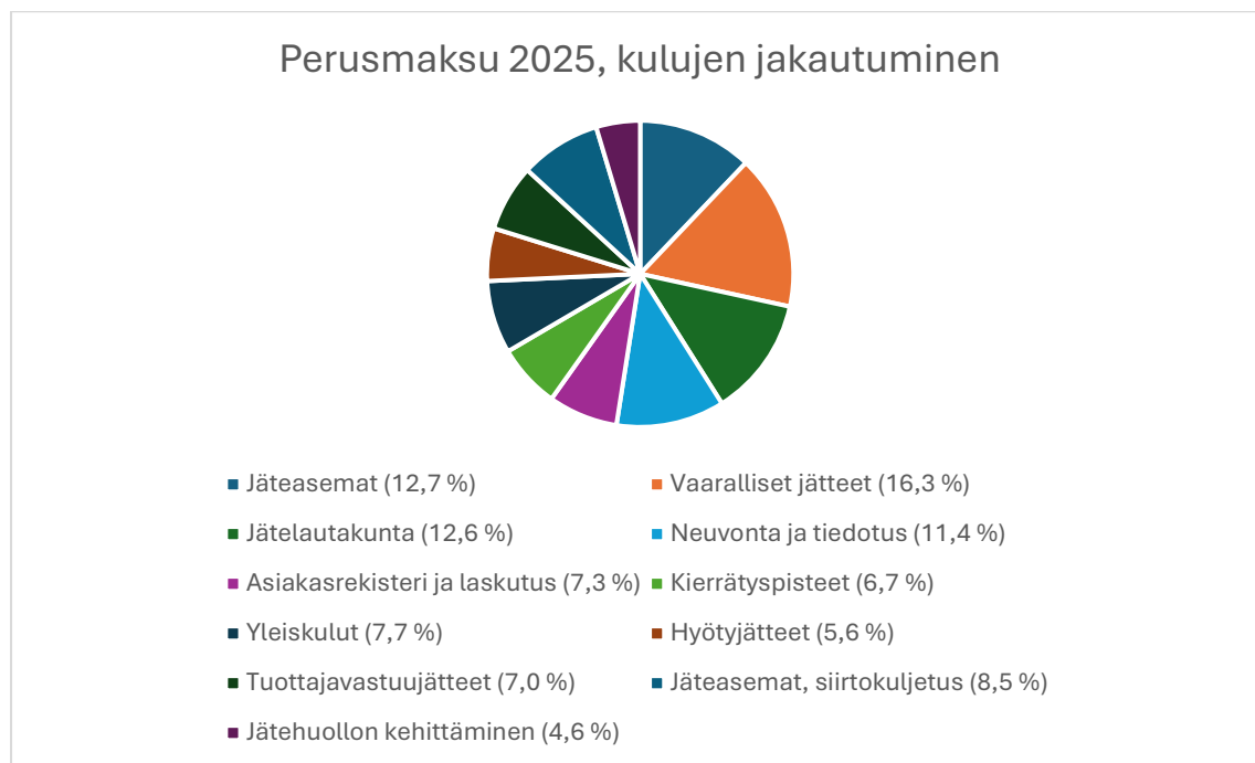
Taulukko 1. Perusmaksu 2025, kulujen jakautuminen