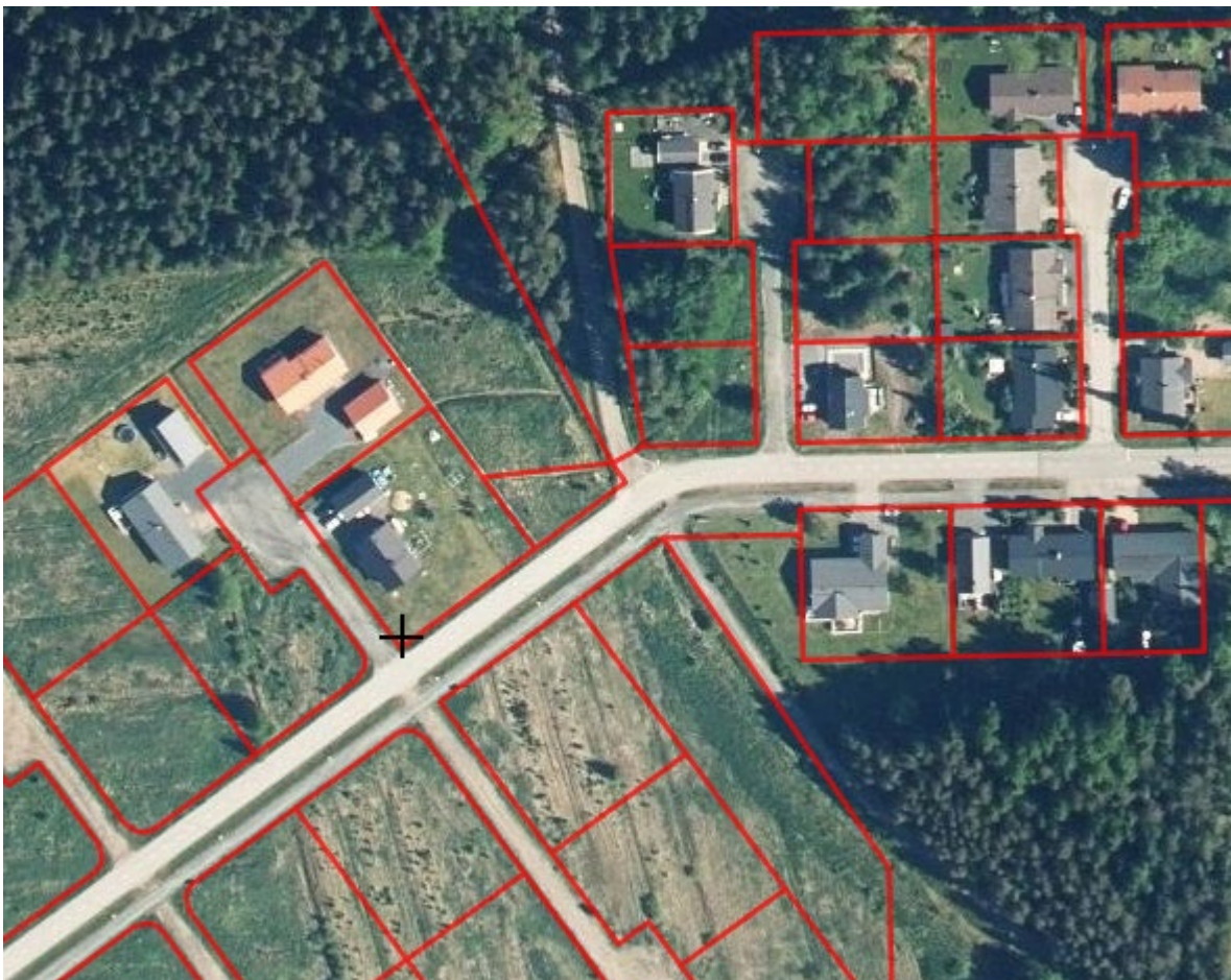
ALUEEN ORTOKUVA 2021